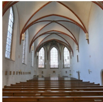
Der Kirchraum (Blick zum Altar)